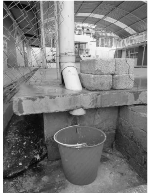
Captura de agua de lluvia en el jardín de niños.