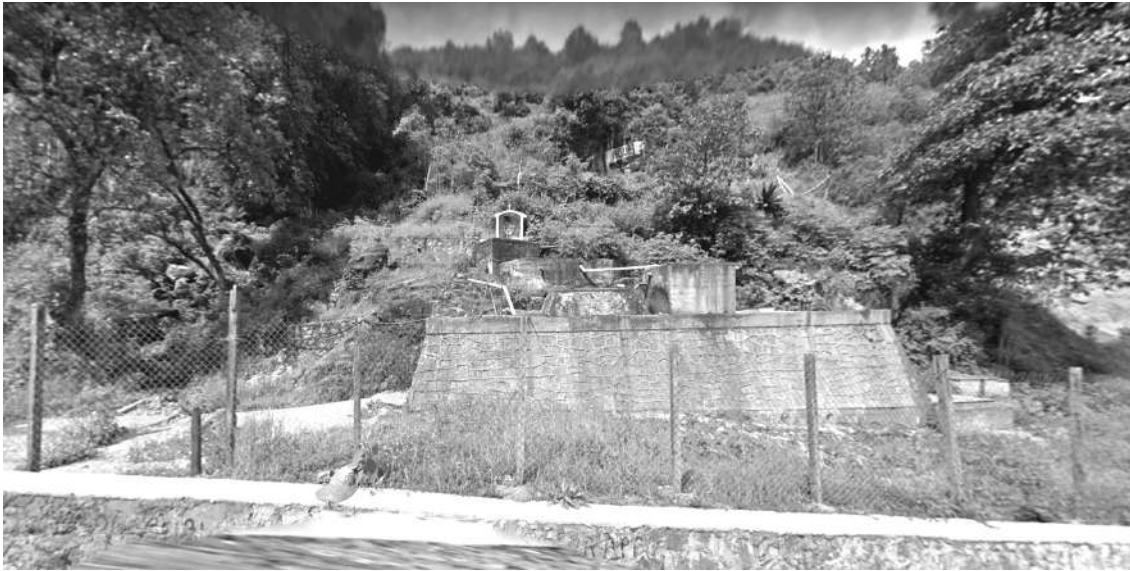
El Manantial antes de la destrucción.