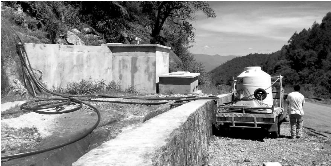
El Manantial hoy.

El sistema de agua potable del municipio de Ayutla se integraba por el tanque ubicado en el Manantial (Tanque 1, el cual fue destruido), una línea de conducción de tubería de metal, de aproximadamente 800 metros (la cual también fue dañada al momento de la destrucción del tanque), y 4 tanques de redistribución que abastecen la red de agua potable de la cabecera municipal, misma que beneficia a una población aproximada de 3000 habitantes. La MCO visitó en conjunto con el Comité de Agua Potable estos tanques de redistribución para verificar su estado y funcionamiento.