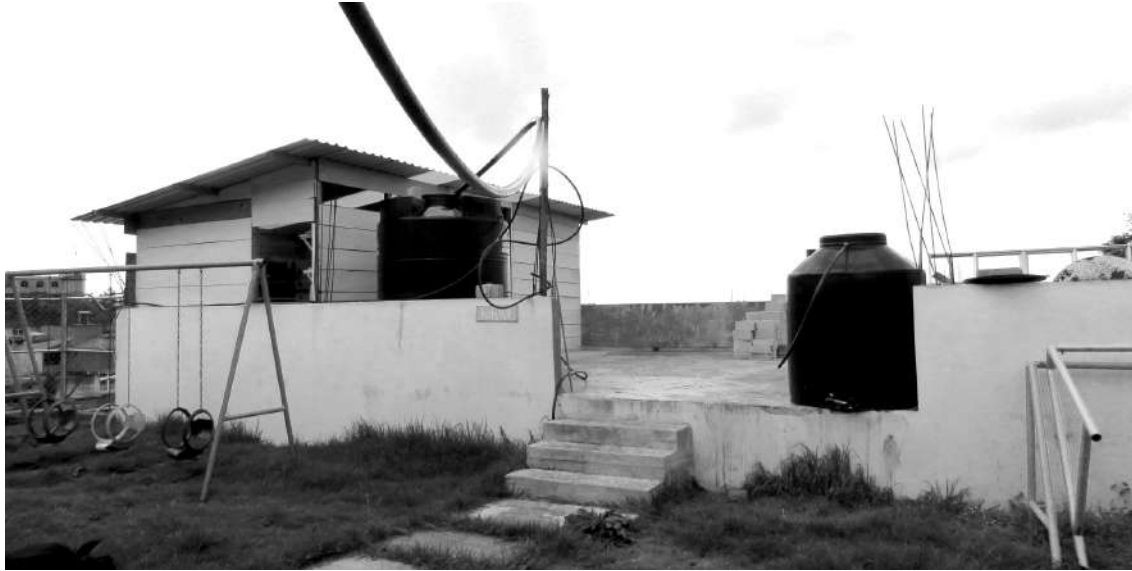
El sistema de agua de la cocina del jardín de niños.