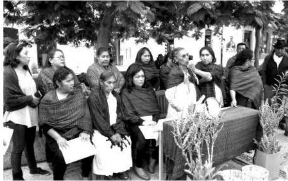
Mujeres de Ayutla en una conferencia de prensa.